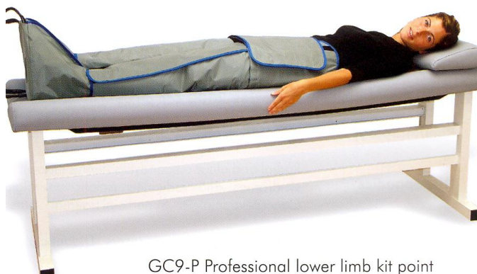
GC9-P Professional lower limb kit point